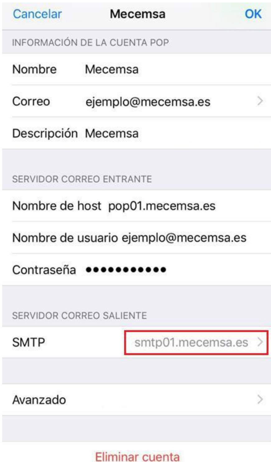
Imagen 6: Datos cuenta de correo configurada

Si se han realizado correctamente los pasos anteriores, en el menú del primer punto ( Imagen 1 ) aparecerá bajo la sección Cuentas la recién configurada. Si hay problemas con la verificación del servidor de salida , hay que pulsar sobre SMTP para configurar los certificados y puertos.