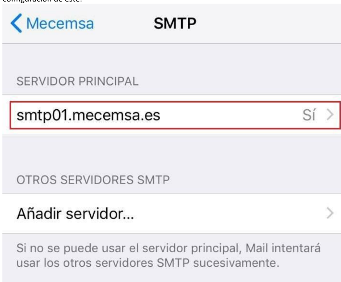
Imagen 7: Configuración SMTP

En el siguiente menú se pincha sobre el SERVIDOR PRINCIPAL para que se muestre la configuración de éste.