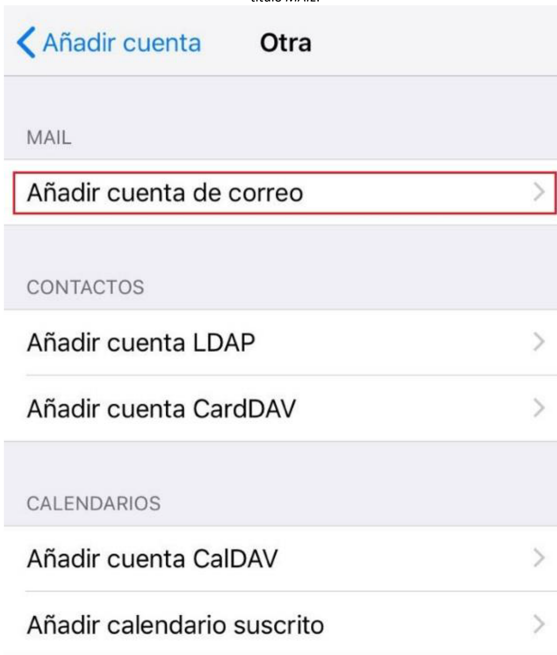
Imagen 3: Añadir cuenta de correo

En la siguiente pantalla hay que seleccionar la primera opción Añadir cuenta de correo , bajo el título MAIL .