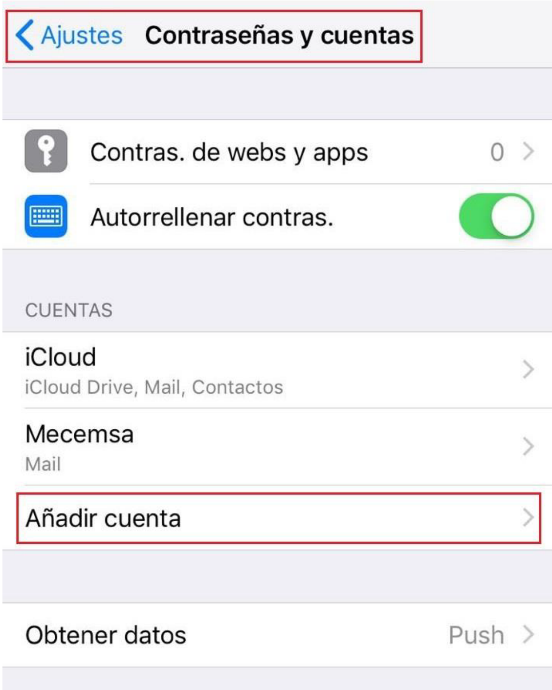
Imagen 1: Ajustes → Contraseñas y cuentas → Añadir cuenta

El primer paso para configurar una cuenta de correo es acceder a la aplicación Ajustes del iPhone o iPad. A continuación, se busca la opción Contraseñas y cuentas y se pulsa en Añadir cuenta .